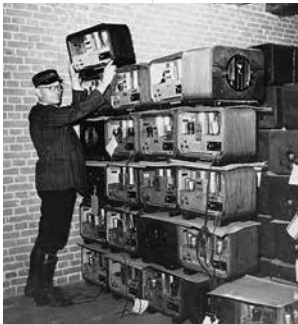
Verzameling door de bezetter in beslaggenomen radio's.

VO Een van de eerste maatregelen na de invasie van Nederland door de Duitse bezetter, was het aan banden leggen van de communicatiemogelijkheden in het land. Kranten, tijdschriften en elektronische communicatie zoals radio, ook die van zendamateurs, werden verboden of onder strikte controle gesteld. En die verboden gingen vrij ver.