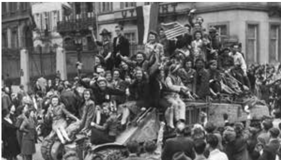
De bevrijding van Brussel op 3 september 1944.

Een woord van waarschuwing is misschien hier nog op zijn plaats. Hoewel op het ogenblik Brussel en vermoedelijk Antwerpen ook al bevrijd zijn, bevinden zich hier en daar nog Duitse elementen die niet op tijd de benen hebben kunnen nemen en derhalve hebben besloten het uit te vechten. Dat zijn voornamelijk de SS-eenheden, die trouwens wel weten wat hun te wachten staat als ze zich aan de bevolking overgeven in afwachting van de geallieerde troepen.