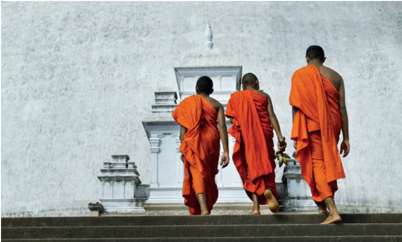
Monniken bezoeken de dagoba ruvanvelisaya.

De waardevolle getuigen van het grootse verleden zijn van hun junglegevangenis bevrijd en Sri Lanka herrijst uit zijn as als een feniks. De Sri Lankanen hebben hun glimlach teruggevonden en ontvangen bezoekers uit alle hoeken van de wereld met open armen.