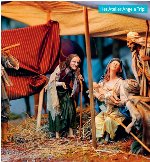
Het Atelier Angela Tripi