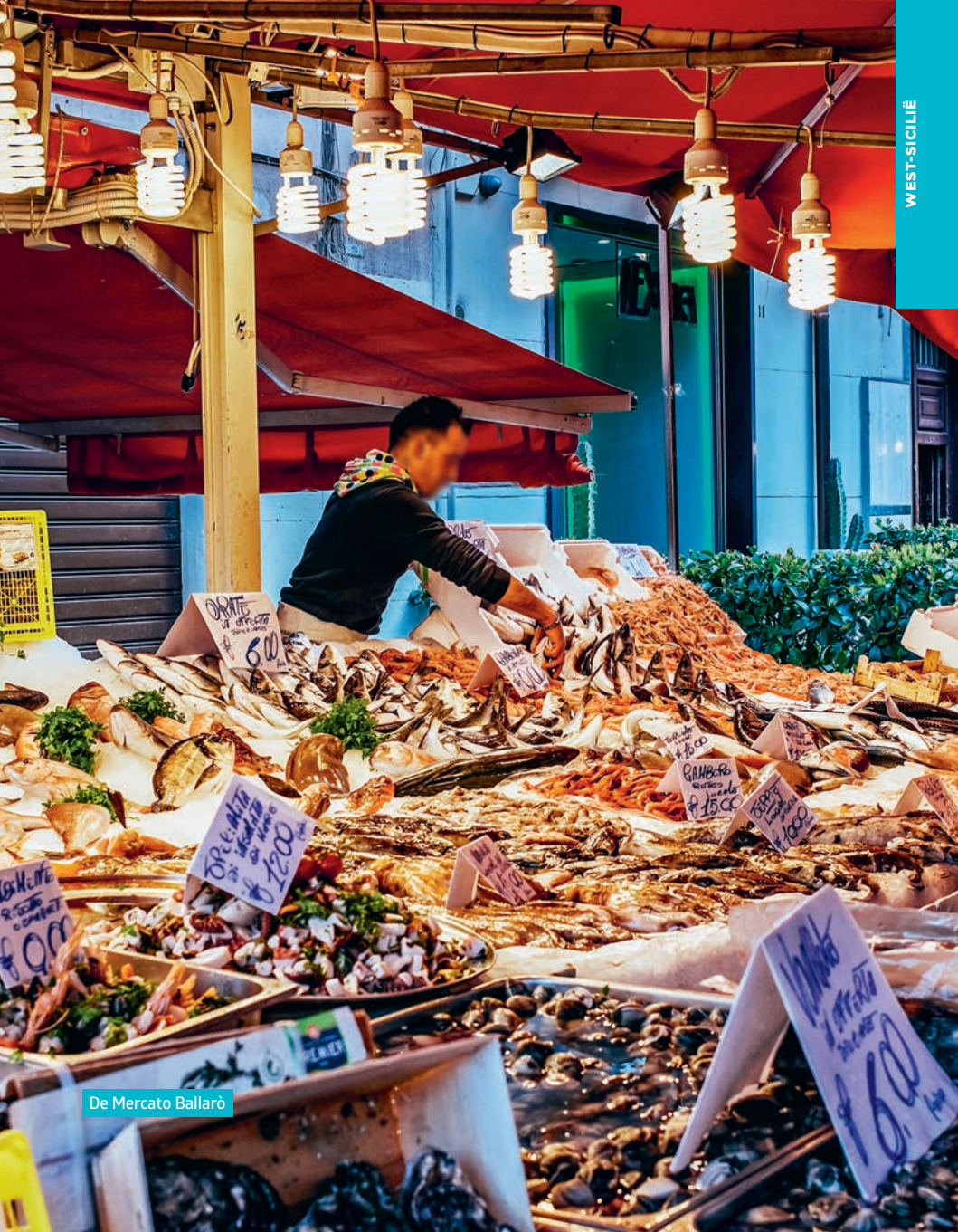
De Mercato Ballarò