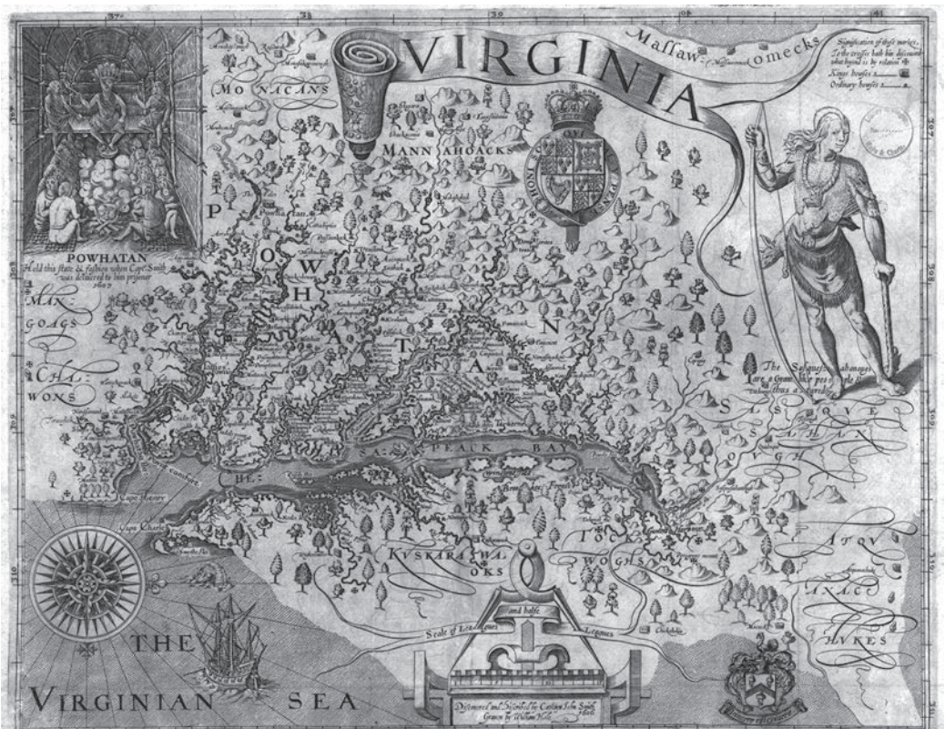
Een van de eerste kaarten van de kolonie Virginia, daterend uit 1620. Linksboven een verwijzing naar de oorspronkelijke bewoners van het gebied, de Powhatan.

Het is verleidelijk de Founding Fathers te presenteren als een band of brothers , krijgers die elkaar in een oorlog door dik en dun steunen, een aantrekkelijk romantisch maar misleidend beeld. Zo klip-en-klaar als dat beeld suggereert was het allemaal niet. Er was sprake van tegengestelde belangen, botsende analyses en elkaar uitsluitende visies. Vaak namen ontwikkelingen een onverwachte keer, menigmaal moest er geïmproviseerd worden. Soms werkten de heren samen, soms haatten ze elkaar met passie. Gekwetste ego's koesteren, elkaar dwarszitten, een ijdel tuit omlaaghalen of een ideoloog dwarsbomen: het was allemaal onderdeel van het proces van grondleggen. Niettemin rolde er op cruciale momenten een collectief resultaat uit: in 1776 de Onafhankelijkheidsverklaring en in 1787 de grondwet, beide revolutionair en beide creatieve politieke hoogstandjes. Zo rond 1800, toen het laat-