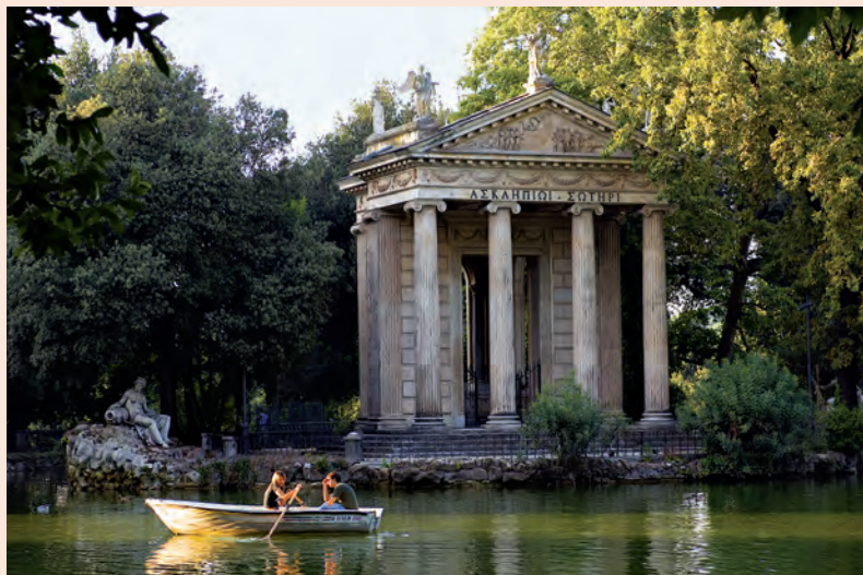
Tempio di Esculapio bij de Villa Borghese werd in de 19e eeuw gebouwd ter verfraaiing van het landschap.

Rome is een van de groenste steden van Europa. Het grote aantal parken – gewoonlijk geopend van zonsopkomst tot zonsondergang en een ideaal voor joggers, bejaarden en daklozen – is te danken aan de aristocratie van de stad én aan haar financiële problemen, waardoor ze in de 20e eeuw gedwongen was haar bezit aan de stad over te dragen. Het woord 'villa' duidt aan dat een park ooit tot het landgoed van een familie behoorde.