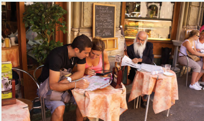
Een van de Romeinse cafés aan de Via del Tritone die zowel inwoners als bezoekers trekken.

Ook de elliptisch gevormde Piazza Navona , anderhalve kilometer ten noordwesten van de Capitolijs musea mag u niet missen. Oorspronkelijk bevond zich hier het stadion van keizer Domitianus uit de 1e eeuw en de renaissancistische en barokke gebouwen rondom het plein zijn op de fundamenteën ervan gebouwd. Overdag gonst de plek van alle activiteiten die er plaatsvinden. U treft er straatartiesten, caféhouders, kunststudenten en toeristen die de details van Bernini's schitterende fontein of Borromini's imposante façade van de kerk van Sant'Agnese in Agone bestuderen. Van hier is het een korte wandeling naar het Pantheon , een van de subliemste voorbeelden van de Romeinse klassieke architectuur en de schitterende nabijgelegen kerk van Santa Maria sopra Minerva .