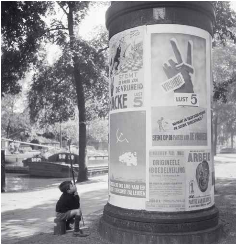
Een aantal dagen voor de eerste Tweede Kamerverkiezingen na de Tweede Wereldoorlog kijkt een jongen de verkiezingsposters, 14 mei 1946.

woordiging. Aan verzoeken van het noodparlement om ook andere (wets-)ontwerpen aan de orde te stellen, geeft minister-president Schermerhorn geen gehoor. Tot op het laatste moment handelt het kabinet zo veel mogelijk zaken af via (koninklijke) wetsbesluiten, en wordt het parlement er buiten gelaten. De eerste stappen op weg naar het herstel van de democratie worden dus gekleurd door een veel grotere invloed van oude politieke stromingen dan door velen gehoopt, en een regering die zowel de bestuurlijke als wetgevende touwtjes stevig in handen houdt. 44