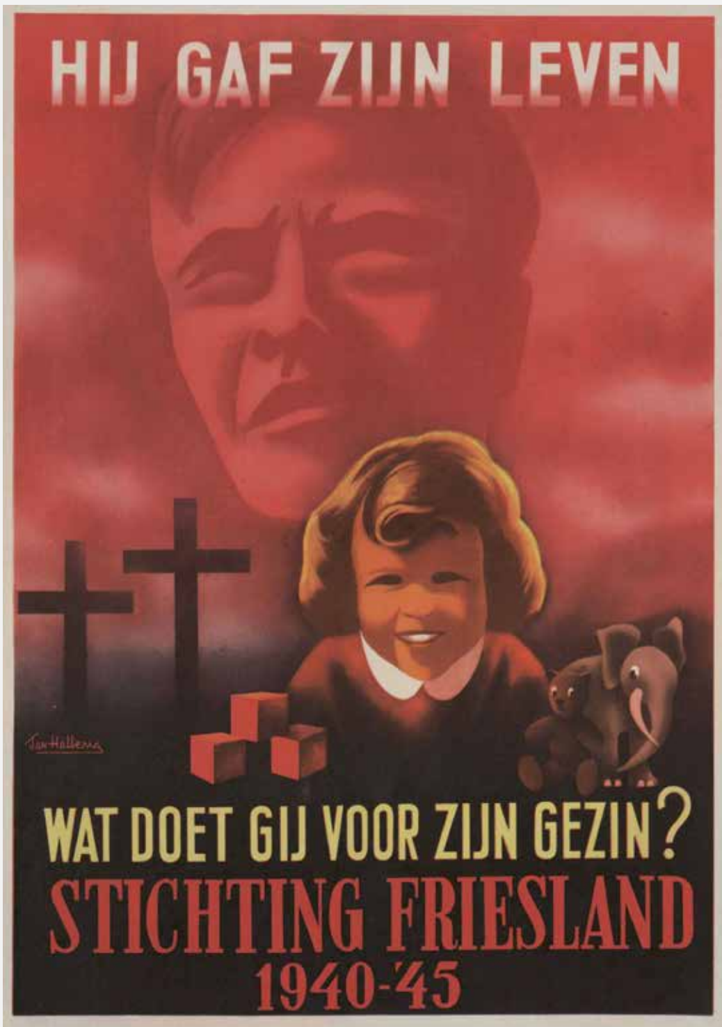
Affiche van de Friese Stichting 1940-1945 met een oproep tot donatie ter ondersteuning van haar werkzaamheden. De stichting richt zich op hulp aan nabestaanden van gevallen verzetsstrijders in de provincie Friesland.