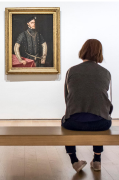
→ Een bezoeker bewondert een werk in het Museo de Bellas Artes

moderne werken van internationale kunstenaars, zoals Vasarely, Kokoschka, Bacon, Delaunay en Léger. De toegang tot het museum is na 18.00 uur gratis. De rondleidingen zijn alleen in het Spaans of Baskisch. Het caféterras is in de zomer open.