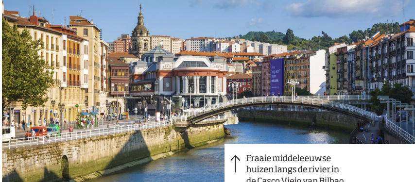
↑ Fraaie middeleeuwse huizen langs de rivier in de Casco Viejo van Bilbao