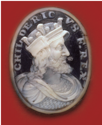
4 Camee uit ca. 1630 met portret van Childeric, hoogte 2,4 cm. Collectie en foto: Parijs, Bibliothèque Nationale de France - Cabinet des Antiques, Camee 859.

De Merovingische tijd heet zo naar Merovech, de mythische voorvader van Childeric en zijn zoon Clovis, de eerste christelijke koning van Frankrijk. Het Merovingische koningsgeslacht komt oorspronkelijk uit onze streken (Hamaland, omgeving Zutphen) en wordt groot met Childeric en Clovis in de tweede helft van de vijfde eeuw. Childeric (afb. 4) noemt zichzelf ‘rex francorum’, koning van de Franken, en is op munten afgebeeld in de dracht van het Romeinse leger maar met lang haar, wat de Frankische elite karakteriseert. Hij zetelt in Doornik en sterft in 481 of 482; in zijn Doornikse graf is veel goud met rood granaat aangetroffen, dan een nieuwe mode in Gallië. Zijn zoon Clovis laat zich bekeren, onder invloed van zijn vrouw Clothilde; hij is gedoopt door de bisschop en later heilige Remigius (Rémi) in Reims in de kerstnacht van 495 of 498 (zie afb. 3). Hierna plaatst hij zijn oorlogspolitiek in teken van het christendom: na de overwin-