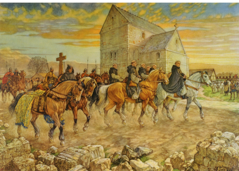
1 Schoolplaat 'Willibrord, de apostel der Friezen' door Isings, De Jongh en Wagenfoort, 1954, 77 x 106,5 cm. Collectie en foto: Leiden, Rijksmuseum van Oudheden, Z 2013/2.2.

Archeologisch zijn de Vroege Middeleeuwen echter één van de rijkste periodes uit de Nederlandse geschiedenis. Het was in deze tijd een algemeen gebruik om doden in hun graf te voorzien van sieraden, wapens en gebruiksvoorwerpen, zodat er heel veel van de materiële cultuur bewaard gebleven is, met een duidelijke koppeling van bepaalde objecten aan man,