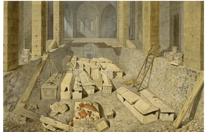
5 Opgravingen in de crypte van Sainte-Geneviève in Parijs in 1807, afgebeeld door A. Bourla in 1850. Collectie en foto: Parijs, Bibliothèque Nationale de France, Est. coll. Destailleur, t.II, f 62, nr. 302.

Clovis sterft in 511 en wordt begraven in de door hem gestichte kerk op het graf van Sainte-Geneviève in Parijs – waar nu het Panthéon staat (afb. 5). Na zijn dood wordt het