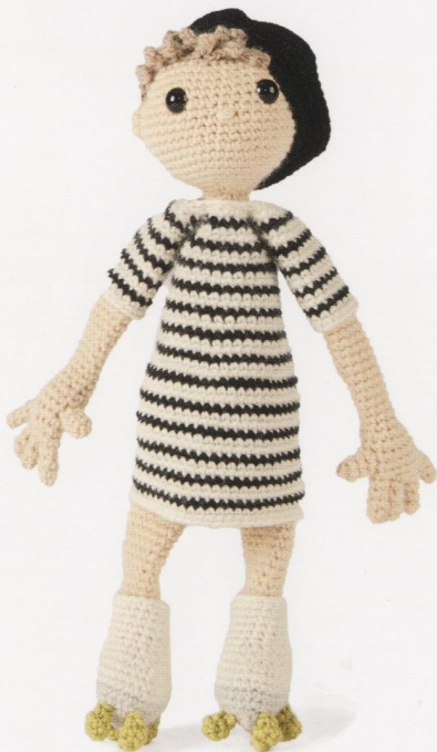
H15, K1 jurk, K7 rolschaatsen en BARET (blz. 66)