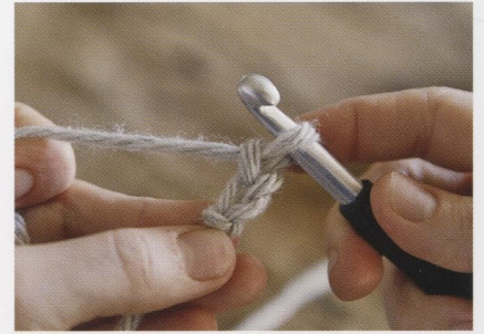
Basisring (6 v in een ring)