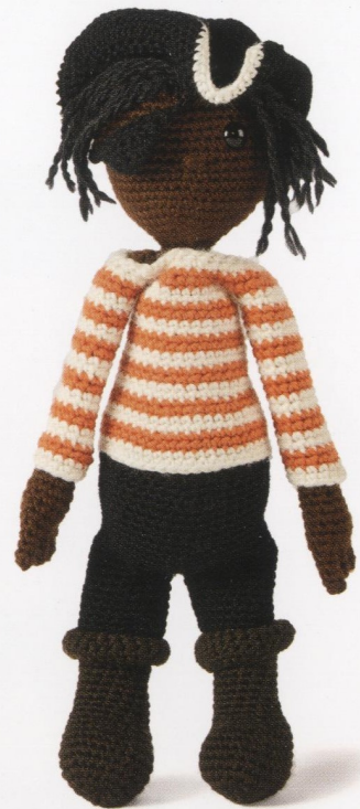
H18, K12 met OOGGLAPJE en PIRATENHOED (blz. 67)