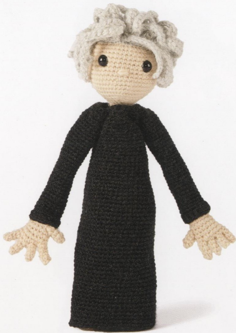
H11, K3 in Charcoal met rechte mouwen