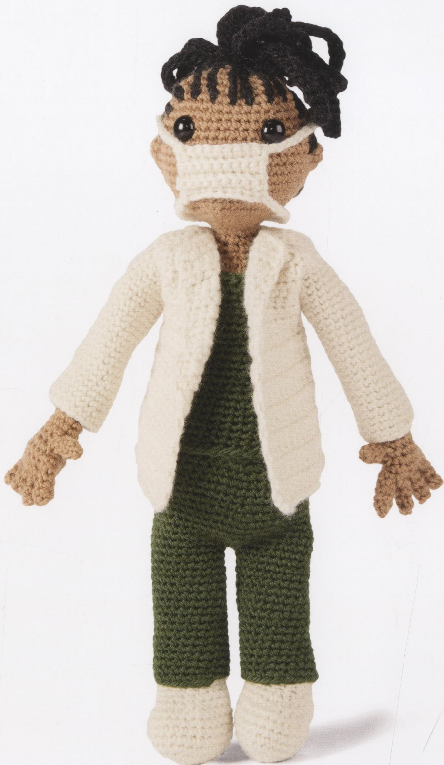
H7, K22 met CHIRURGENMASKER (blz. 66)